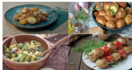
> Le spot TV illustre la diversité des recettes

Afin de favoriser la présence à l'esprit et la fréquence d'achat sur le temps fort de saison, le partenariat établi en hiver 2022 avec l'émission Un Si Grand Soleil sur France 2, a été renouvelé de mai à juillet 2022. Le spot TV « Il y a de la pomme de terre dans l'air ! » adapté à la primeur met en avant la saisonnalité et la diversité des recettes à cuisiner avec 4 exemples illustrés. Il a été diffusé juste après le journal télévisé de 20h sur France 2, à une