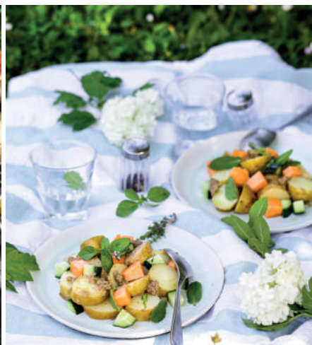
> Salade de pommes de terre nouvelles pour un déjeuner sur l'herbe