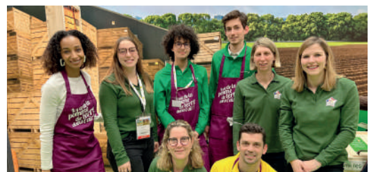
> Patate team du mardi