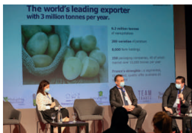
> La table ronde sur le thème du Pacte Vert.

A l'occasion de l'exposition universelle qui se tient d'octobre 2021 à mars 2022 à Dubaï, Taste France organise des actions de promotion des produits agricoles français s'adressant à une large cible internationale. Les pommes de terre françaises représentées par le CNIPT, ainsi qu'INTERFEL et le CNIEL, ont participé à un dispositif déployé du 12 au 14 décembre 2021 lors de la Semaine de l'éducation. Au programme : une conférence sur l'Alimentation de demain, des démonstrations culinaires avec dégustation des produits français et des rendez-vous BtoB.