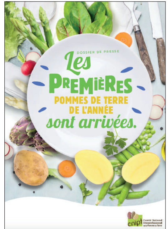
> Dossier de presse primeur 2021 élaboré et diffusé par le CNIPT

des ambassadeurs par bassin de production. Les portraits de ces femmes et ces hommes qui font les pommes de terre de primeur ont donné l'envie aux médias de réaliser des reportages. Et les objectifs pédagogiques et de consommation fixés par la Commission ont été atteints. Ainsi, plusieurs bassins ont bénéficié d'opportunités d'interviews et au total ce sont près de 21,5 millions de Français qui ont visionné ou lu un article sur les pommes de terre de primeur.