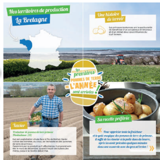
> Série de publications pédagogiques sur Facebook mettant en avant les terroirs de production primeur.