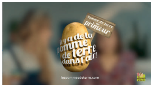
> Le spot publicitaire dédié a été diffusé du 13 mai au 13 juin 2021 en Replay TV sur MY TF1 et 6Play.

Un plan média a permis de renforcer la présence à l'esprit durant la pleine saison des pommes de terre de primeur afin d'en développer la consommation. Le spot publicitaire dédié a été diffusé du 13 mai au 13 juin 2021 en Replay TV sur MY TF1 et 6Play. L'avantage de ce dispositif est d'assurer un visionnage du spot en entier et donc une assimilation optimale des messages diffusés. Cette opération a été renforcée par une diffusion du spot sur Facebook.