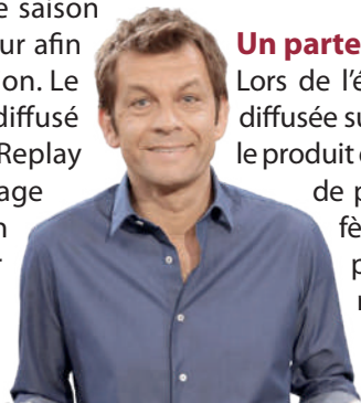
> Laurent Mariotte, présentateur de l'émission Petits Plats en Equilibre sur TF1

Lors de l'émission Petits Plats en Equilibre diffusée sur TF1, Laurent Mariotte a sublimé le produit en réalisant une recette de cocotte de pommes de terre de primeur aux fèves. L'épisode a été diffusé une première fois en mai, puis a été rediffusé 10 fois sur mai et juin. Il a permis de faire passer des messages éducatifs autour de la saisonnalité de la primeur tout en donnant l'envie d'en cuisiner.