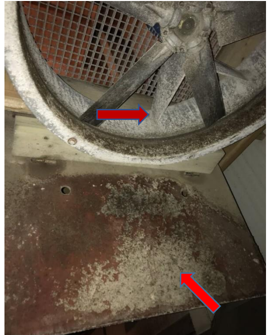
Figure 3 – Ventilateur et volet anti-retour en bois présentant des dépôts visibles de CIPC