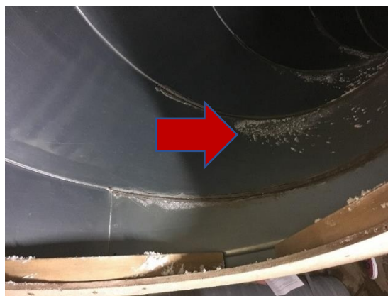
Figures 5&6 - Caisson de réfrigération d'un stockage en caisses et dépôt de CIPC dans un conduit de distribution d'air