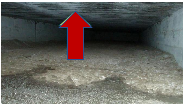
Figure 3 – Gaine enterrée et caillebotis avec dépôts de terre et CIPC