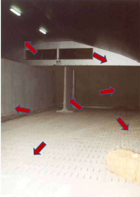
Figure 2 - Emplacements d'un stockage où la présence de résidus de CIPC peut être aisément détectée