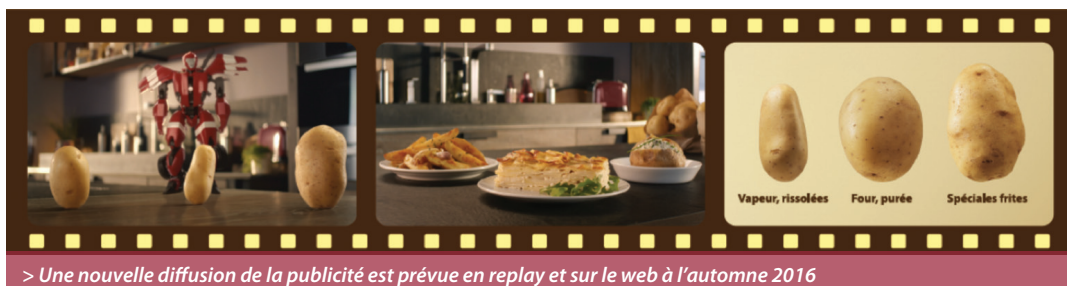
> Une nouvelle diffusion de la publicité est prévue en replay et sur le web à l'automne 2016