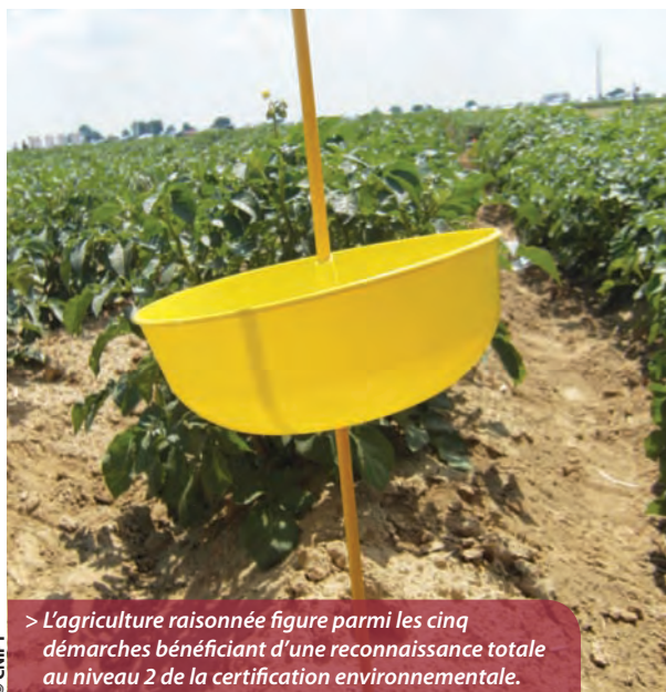
> L'agriculture raisonnée figure parmi les cinq démarches bénéficiant d'une reconnaissance totale au niveau 2 de la certification environnementale.

Les niveaux 2 et 3 sont construits autour de quatre thématiques: biodiversité, stratégie phytosanitaire, gestion de la fertilisation et gestion de la ressource en eau. Ils font l'objet